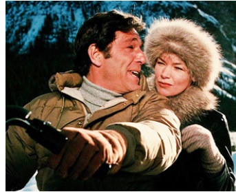
1979 L'AMOUR SUR BÉQUILLES (Lost and found) de Melvin Frank avec George Segal