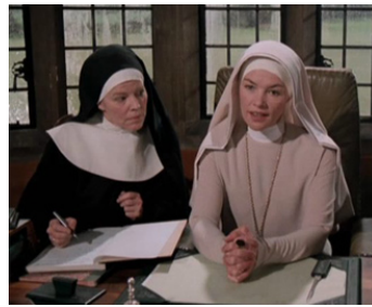
1976 DRÔLES DE MANIÈRES (Nasty Habits) de Michael Lindsay-Hogg avec Sandy Dennis