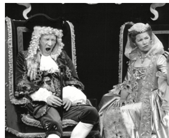
1989 KING OF THE WIND de Peter Duffell avec Richard Harris