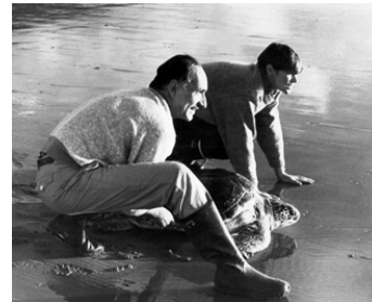
1985 TURTLE (Turtle Diary) de John Irvin avec Ben Kingsley