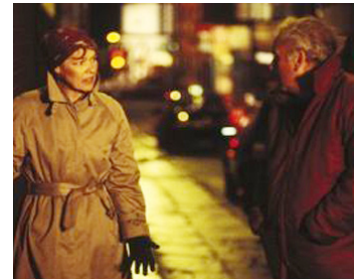
1986 BUSINESS AS USUAL de Lesli-An Barrett avec John Thaw