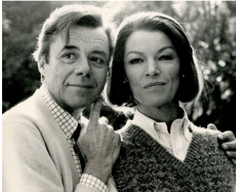
1981 ACTE D'AMOUR (The Patricia Neal's Story) d'Anthony Page avec Dirk Bogarde