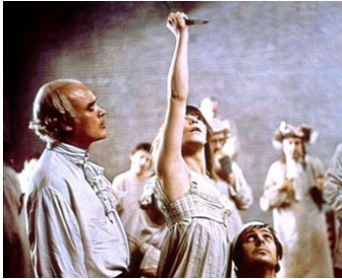
1967 MARAT/SADE (Marat/Sade) de Peter Brook avec Patrick Magee