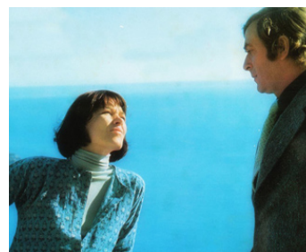
1975 UNE ANGLAISE ROMANTIQUE (A romantic Englishwoman) de J. Losey avec Michael Caine