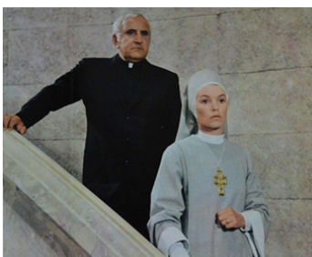
1973 LA TENTATION (Il Sorriso del grande Tentatore) de Damiano Damiani avec Adolfo Celi