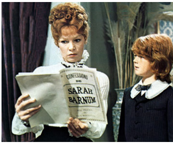
1976 L'INCROYABLE SARAH (The incredible Sarah) de R. Fleischer avec Shaun Davies