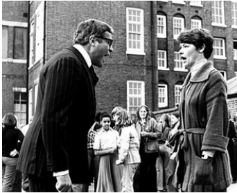
1978 THE CLASS OF MISS McMICHAEL de Silvio Narizzano avec Oliver Reed