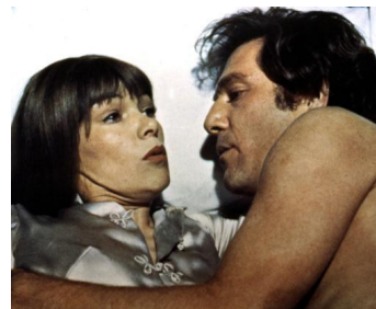
1972 UNE MAÎTRESSE DANS LES BRAS... (A Touch of Class) de Melvin Frank avec George Segal