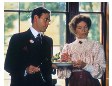
1988 L'ARC-EN-CIEL (The Rainbow) de Ken Russell avec Christopher Gable