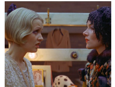
1971 BOY FRIEND (The Boy Friend) de Ken Russell avec Twiggy