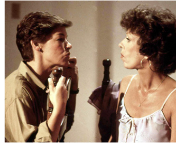
1979 HEALTH (Health) de Robert Altman avec Carol Burnett