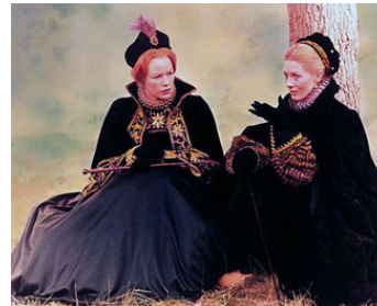
1971 MARY STUART, REINE D'ÉCOSSE (Mary, queen of Scots) de Ch. Jarrott avec V. Redgrave