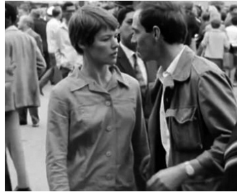
1967 DITES-MOI N'IMPORTE QUOI (Tell me Lies) de Peter Brook avec Paul Scofield