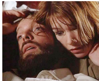
1969 LA SYMPHONIE PATHÉTIQUE (Music Lovers) de Ken Russell avec Richard Chamberlain