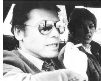
1982 GIRO CITY (And nothing but the truth) de Karl Francis avec Jon Finch