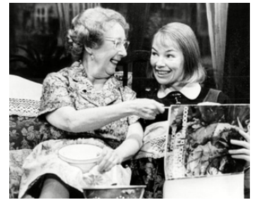
1978 STEVIE (Stevie) de Robert Enders avec Mona Washbourne