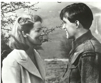
1972 TRIPLE ÉCHO (The Triple Echo) de Michael Apted avec Brian Deacon