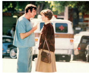
1977 APPELEZ-MOI DOCTEUR (House Calls) de Howard Zieff avec Walter Matthau