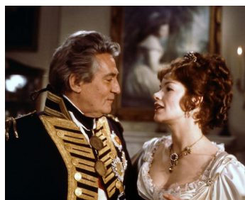
1972 L'AFFAIRE NELSON (The Nelson Affair) de James Cellar-Jones avec Peter Finch