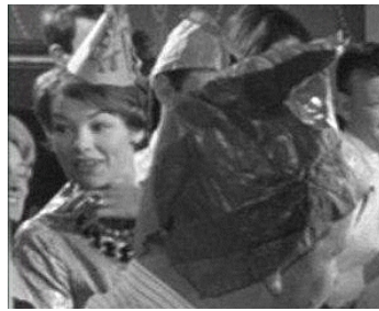
1962 LE PRIX D'UN HOMME (This Sporting Life) de Lindsay Anderson