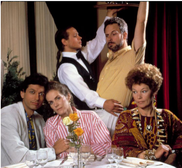
1986 BEYOND THERAPY de Robert Altman avec Jeff Goldblum, Julie Hagerty, Christopher Guest