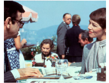
1980 JEUX D'ESPIONS (Hopscotch) de Ronald Neame avec Walter Matthau