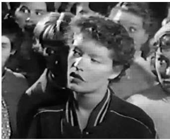
1956 THE EXTRA DAY (The Extra Day) de William Fairchild (figuration)