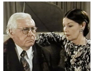
1992 LA VIE SECRÈTE D'ARNOLD BAX (The secret Life of Arnold Bax) de et avec Ken Russell