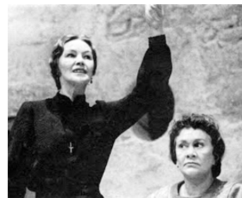
1991 THE HOUSE OF BERNARDA ALBA de Stuart Burge avec Joan Plowright