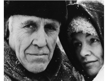
1984 SAKHAROV (Sakharov) de Jack Gold avec Jason Robards