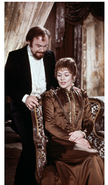
1975 HEDDA (Hedda) de Trevor Nunn avec Timothy West