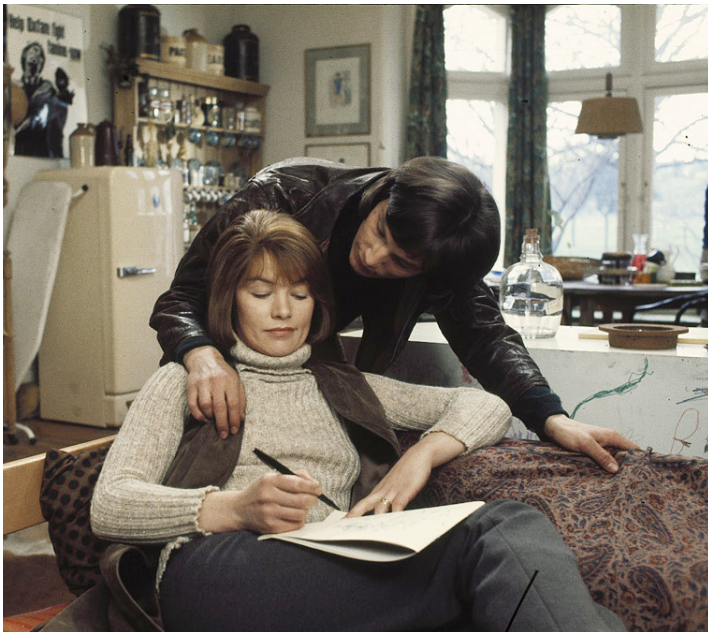
1971 UN DIMANCHE COMME LES AUTRES (Sunday, Bloody Sunday) de John Schlesinger avec Murray Head