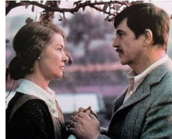
1981 LE RETOUR DU SOLDAT (The Return of the Soldier) d'Alan Bridges avec Alan Bates